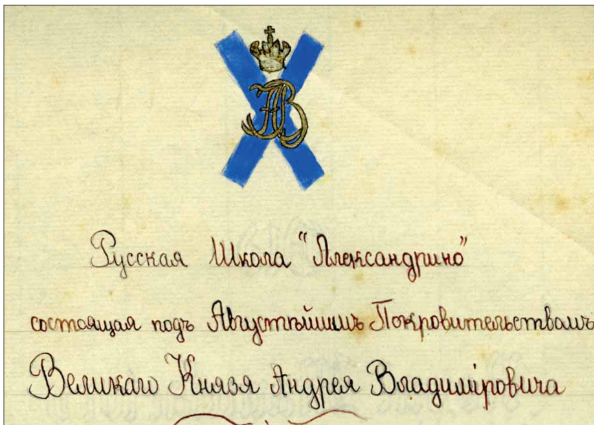
Эмблема школы «Александрино»

О существовавшей в 1920–1930-х годах в Ницце русской школе под таким названием