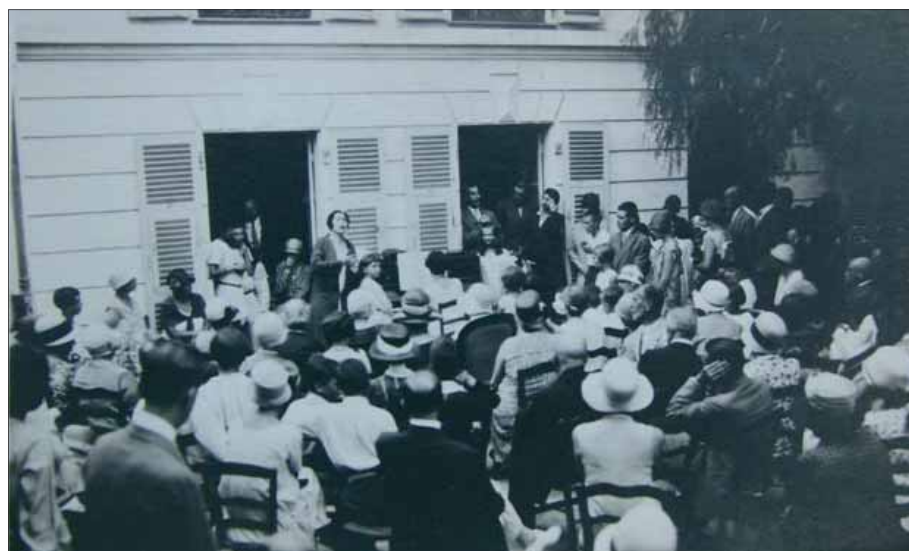
Певица Надежда Васильевна Плевицкая в «Александрино». Фотография 1928 года