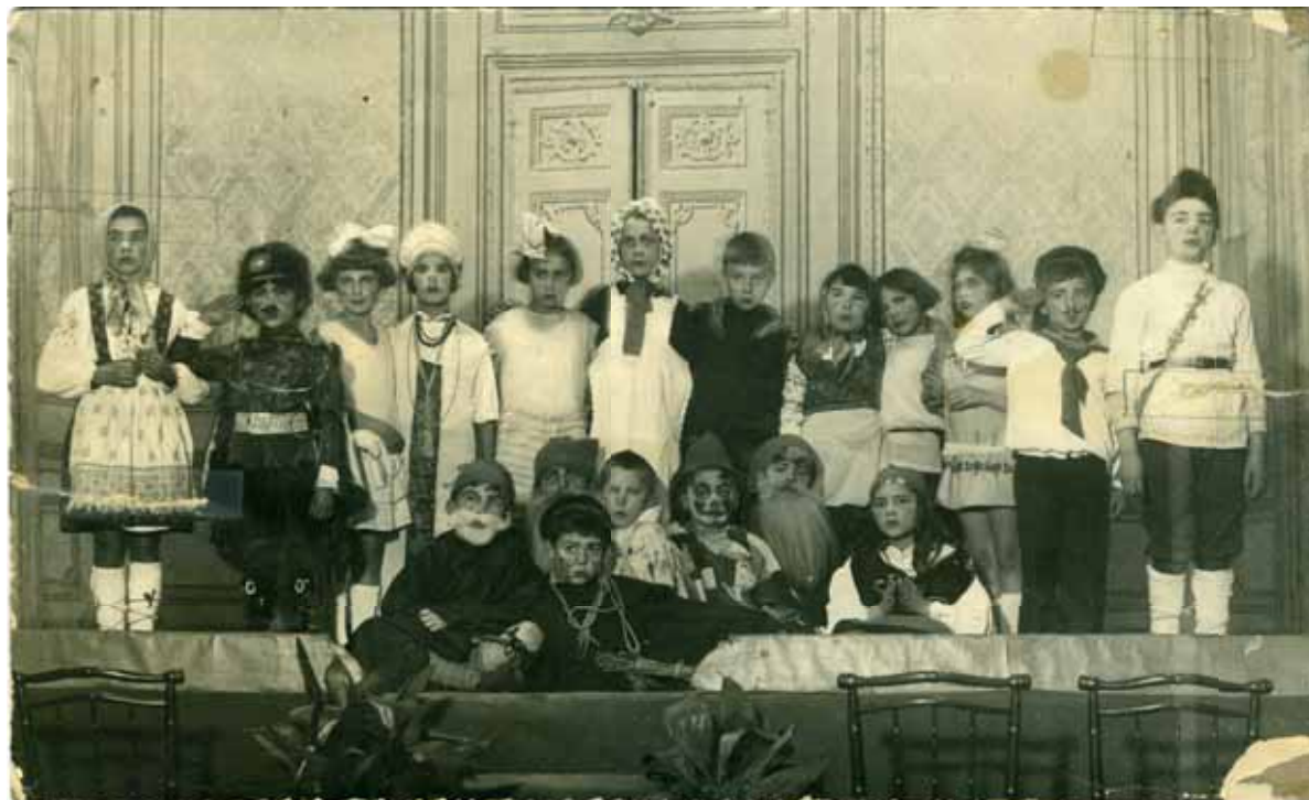
Участники школьной постановки «Горя от ума». Фотография 1920-х годов

то увлечены: ведь не было никакого ТВ, а сколько выдумок — и детских умных мыслей и увлечений».