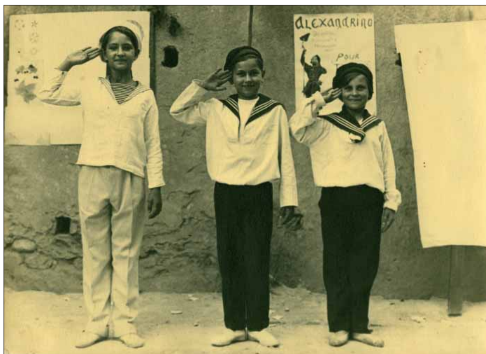
Воспитанники школы после концерта