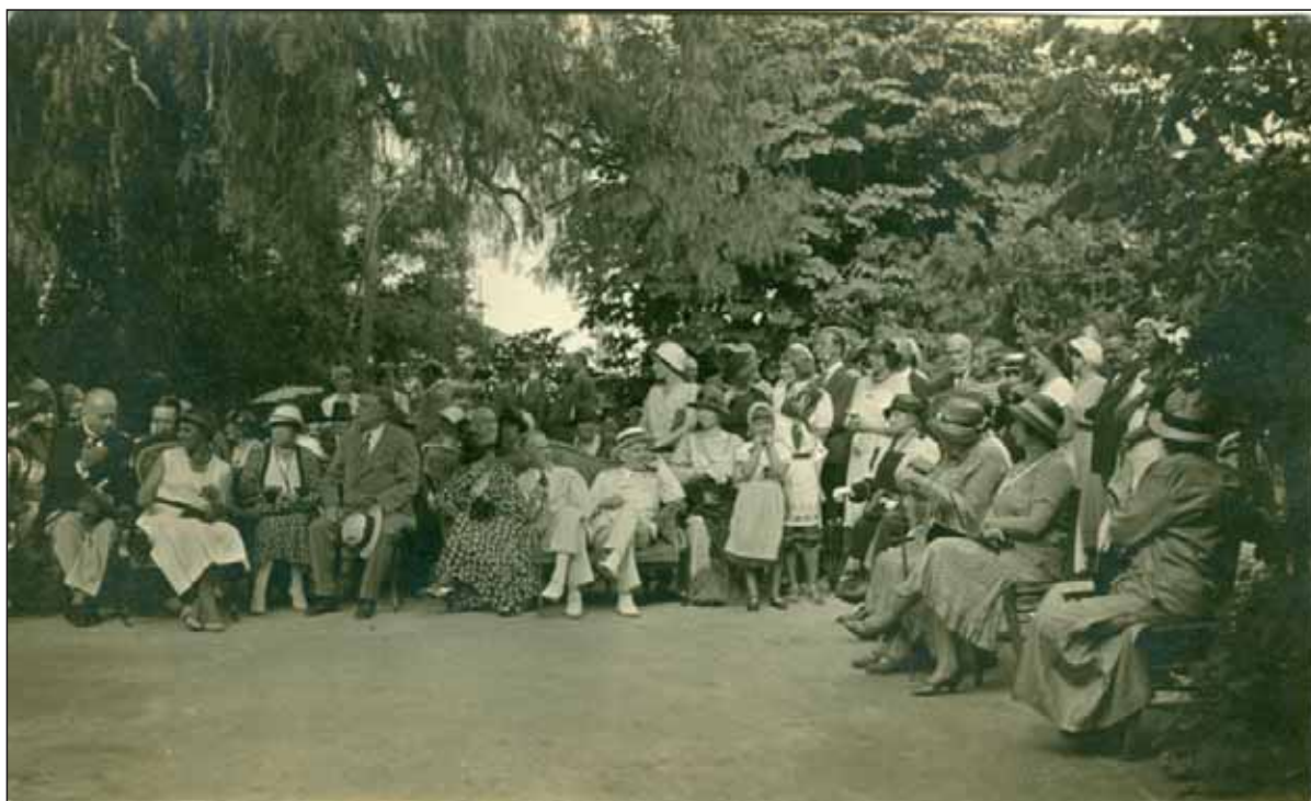
Во дворе школы «Александрино» после торжественного акта по случаю окончания учебного года (1925/26)